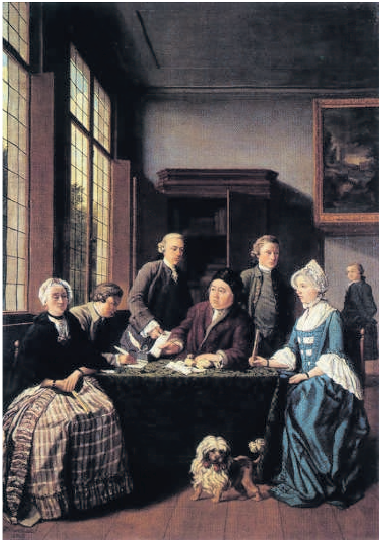
Het schilderij Het huwelijkscontract van Jan Josef Horemans de Oude uit 1768 toont het ondertekenen van een ondertrouwakte op een notaris kantoor.

De Moor en haar collega's staken veel tijd in de voorbereiding van het onderzoek. Een belangrijk onderdeel was het organiseren van excursies, cursussen en lezingen voor de vrijwilligers. 'Ik moet weleens aan collega's uitleggen dat het geen goedkope slavenarbeid is. Mensen doen heel veel werk voor je, dan moet je ook iets