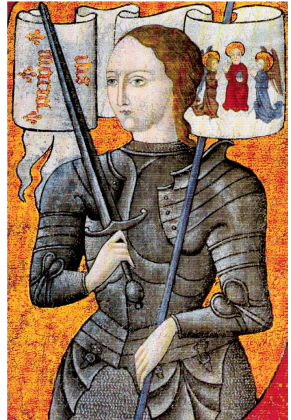
De middeleeuwen hadden ook een zachte, vrouwelijke kant. In de hoofse liefde bijvoorbeeld werd de vrouw geïdealiseerd. Ook Jeanne d'Arc kon als jonge 'maagd' nog een koninkrijk redden, al werd ze later door de machtige mannen in de steek gelaten.

'In de eerste plaats ligt die ingebed in de belangrijkste Chinese filosofisch-religieuze stroming: het confucianisme. Dat hecht zeer veel belang aan de verering van de overleden voorouders, zodat het belangrijk is dat de familienaam, die van vader op zoon wordt overgeleverd, blijft bestaan. Tijdens de Song-dynastie (10de tot 13de eeuw) was de toepassing van die hiërarchische regels nog niet zo strikt. Maar toen de Mongolen China bij hun rijk voegden en in 1271 hun eigen Yuan-